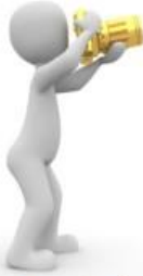
Mesleki Alan İlgisi Ölçeğine Giriş İçin Tıklayınız

"Neleri yapmaktan mutlu olurum ?" sorusunun cevabı ilgilerimizi gösterir. Mesleğimizin gerektirdiği özelliklerle ilgilerimiz benzeştiği ölçüde, meslek hayatımızda daha verimli ve mutlu oluruz.