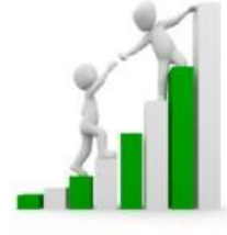
Mesleki Değerlerim Ölçeğine Giriş İçin Tıklayınız

Her birimizin farklı yetenekleri vardır. Bazılarımız spora yetenekliken, bazılarımız sayısal konularda daha yeteneklidir. Kimimiz sanatta, kimimizse yabancı dil öğrenme konusunda daha yeteneklidir. Sahip olduğumuz yetenekler, yöneleceğimiz meslekle eşleştiği zaman mesleğimizde hem daha başarılı, hem daha mutlu oluruz.