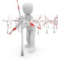
Yeteneklerim Ölçeğine Giriş İçin Tıklayınız

Muhasebeci, belgeleri düzenlemekten, hesap yapmaktan, ayrıntılarıyla uğraşmaktan hoşlanır. Ülkedeki adalet sistemine ilgisi olan bir kişi ise hakim, savcı veya avukat olabilir.